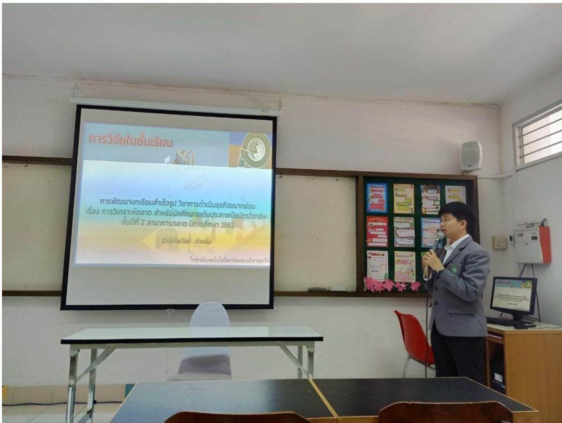
รูปภาพการนำเสนอผลงานวิจัย