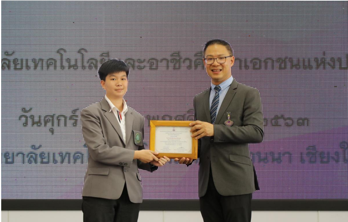
รูปภาพการรับมอบรางวัลงานวิจัย