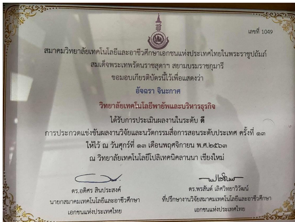
รูปภาพเกียรติบัตร