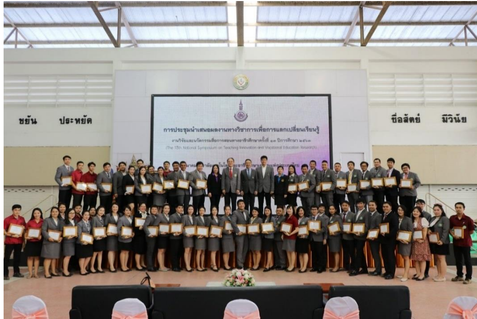
รูปภาพการรับมอบรางวัลงานวิจัย