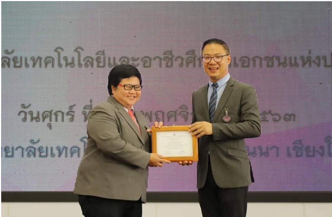
รูปภาพการรับมอบรางวัลงานวิจัย