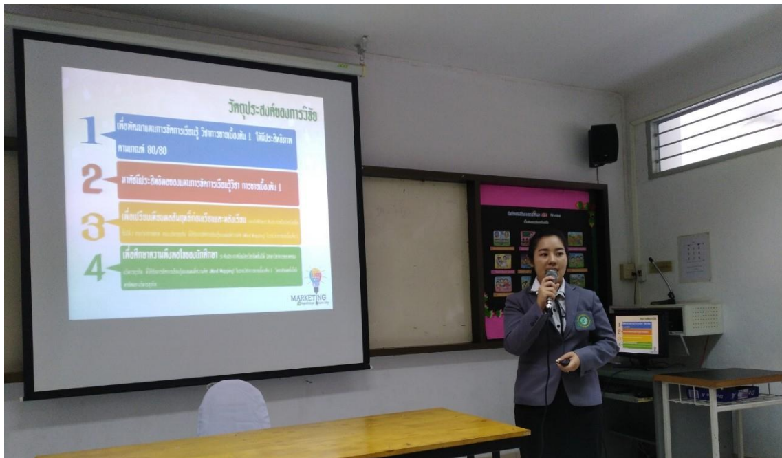
รูปภาพการนำเสนองานวิจัย